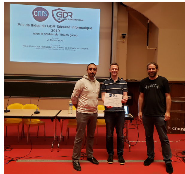
Remise du prix de thèse 2019.

Rendez-vous donc au printemps 2020 à Paris pour la prochaine édition des Journées Nationales et son lot de rebondissements !