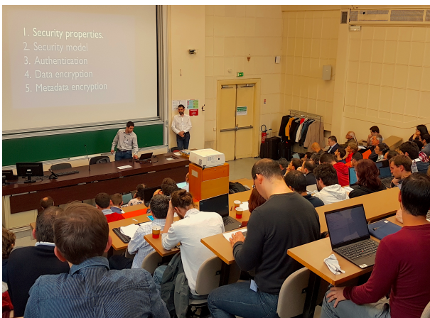
250 personnes se sont inscrites aux Journées Nationales.